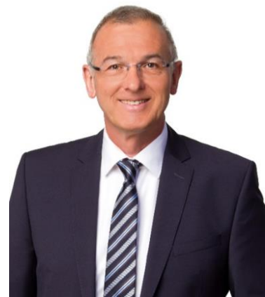
Wolfgang Hauber, MdL Innenpolitischer Sprecher

diese Woche hat unsere Staatsregierung weitere Lockerungen verkündet: Bildungskurse, Freibäder, Fitnessstudios, Kinos und Theater öffnen im Laufe der Pfingstferien. Nach und nach kehrt eine neue Normalität ein – in welcher der Gesundheitsschutz nach wie vor an oberster Stelle steht. Wir FREIEN WÄHLER blicken gleichzeitig auf die Zeit nach Corona: Wie können wir Bayern fit für die Zukunft machen, um künftigen Krisen noch besser zu begegnen? Eine äußerst wichtige Frage, die wir in der Aktuellen Stunde zum Thema „ Lehren aus Corona: Krise meistern – Zukunft sichern! “ im Bayerischen Landtag thematisiert haben.