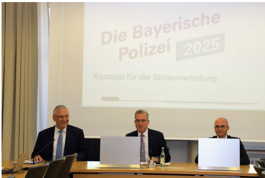
Staatsminister Herrmann zu Besuch in der Fraktionssitzung

Eingesetzt haben wir uns auch für einen einheitlichen Vollzug bei Bau- maßnahmen im Außenbereich . Wir wollen die Landwirtschaft weiter mit einem „zweiten Standbein“ im Tourismus stärken. Doch dem Ausbau von Ferienzimmern und -wohnungen auf dem Bauernhof sind enge Grenzen ge- setzt. Problematisch ist dabei, dass die Genehmigungsbehörden uneinheit- lich beurteilen, ob die landwirtschaftsfremde Betätigung dem bäuerlichen Betrieb wirklich ‚untergeordnet‘ ist – also nur dem Nebenerwerb dient. Ge- rade kleinere Betriebe mit geringeren Erträgen aus der landwirtschaftlichen Produktion haben oftmals Schwierigkeiten, ihren „untergeordneten“ Cha- rakter der Vermietung von Ferienzimmern und -wohnungen zu belegen. Ein bayernweit einheitlicher Vollzug hilft daher gerade kleineren Betrieben, diese Kriterien leichter erfüllen zu können. Denn die touristische Erschlie- ßung bietet Landwirtschaftsbetrieben ein zweites Standbein und trägt zum Erhalt der wertvollen kleinbäuerlichen Strukturen in Bay- ern bei . Die Verbesserung der Verwaltungspraxis bei Genehmigungen stärkt so gleichermaßen Landwirtschaft, Tourismus und den ländlichen Raum – nachhaltiger kann Urlaub nicht sein.